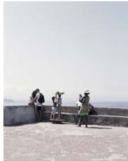
Mathieu Farcy Série « Paysages orientés », Point sublime - gorges du Verdon, 2014