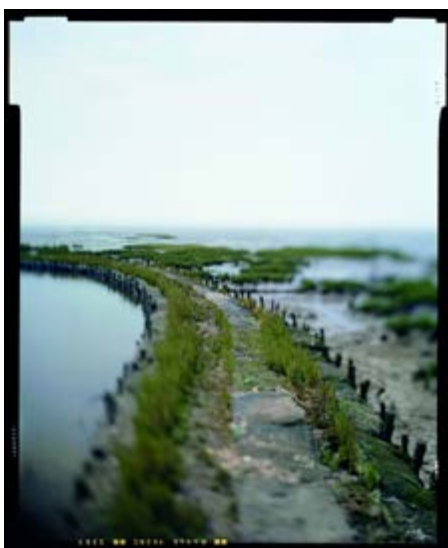
Mission photographique du Conservatoire du littoral Série « Delta de la Leyre », 2006-2007 Fonds géré par l'association À travers le paysage, Arles