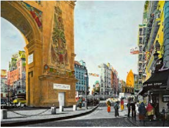
Fred Delangle France(s) territoire liquide Série « Paris-Delhi » Porte Saint-Denis, 10ème arrondissement, Paris colorisé par Ashesh Josh, 2010