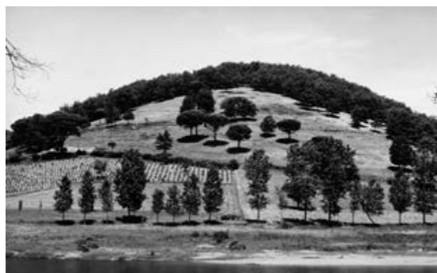
Pierre de Fenoÿl Mission photographique de la DATAR Série « Campagnes du Sud-Ouest » 10/07/87, 14 h, Tarn, 1987