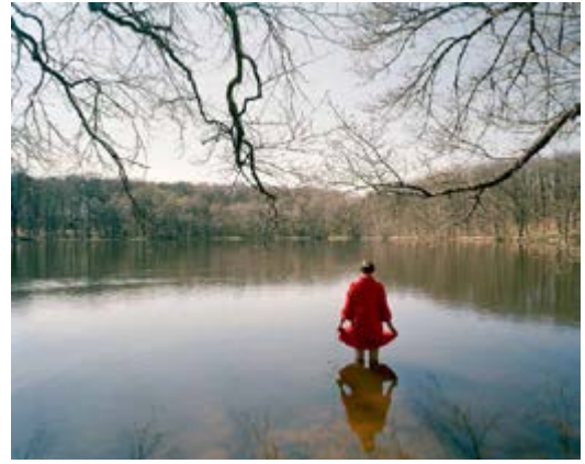
Elina Brotherus France(s) territoire liquide Série « 12 ans après », L'Étang 2012 Elina Brotherus © ADAGP, Paris 2017 Galerie Gb Agency, Paris. BnF, Estampes et photographie