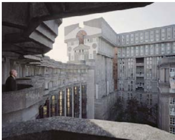
Laurent Kronental Série « Souvenir d'un Futur » Joseph, 88 ans, Les Espaces d'AbraXas, Noisy-le-Grand, 2014