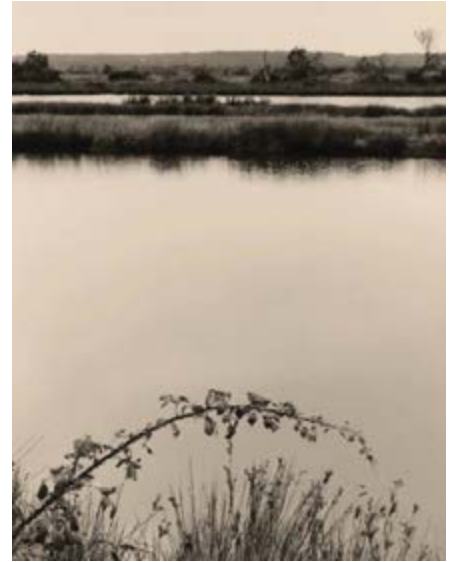
Suzanne Lafont Mission photographique de la DATAR Série « Domaine des Certes, Audenge (Gironde) » 1986 © Suzanne Lafont BnF, Estampes et photographie