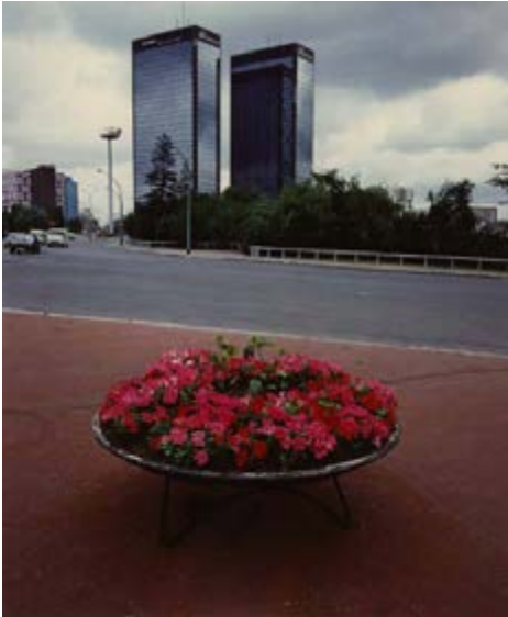
Robert Doisneau Mission photographique de la DATAR Série « Banlieue d'aujourd'hui, dans les banlieues et villes nouvelles de la région parisienne » Tours Mercuriales, Porte de Bagnolet, Bagnolet (Seine-Saint-Denis), 1984

Les œuvres de l'ADAGP ( www.adagp.fr ) peuvent être publiées aux conditions suivantes : • Exonération des deux premières œuvres illustrant un article consacré à l'exposition de la BnF en rapport direct avec celle-ci et d'un format maximum d'1/4 de page • Au-delà de ce nombre ou de ce format les reproductions seront soumises à des droits de reproduction/représentation • Toute reproduction en couverture ou à la une devra faire l'objet d'une demande d'autorisation auprès du Service Presse de l'ADAGP.