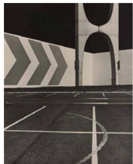
Albert Giordan Mission photographique de la DATAR Série « Espaces commerciaux », Montage photographique, 1984