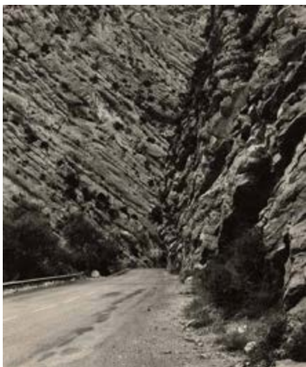
Sophie Ristelhueber Mission photographique de la DATAR Série « Ouvrages d'art et paysage en montagne » N 202, entre Barrême et Digne ( Alpes-de-Haute-Provence ), 1986 Sophie Ristelhueber