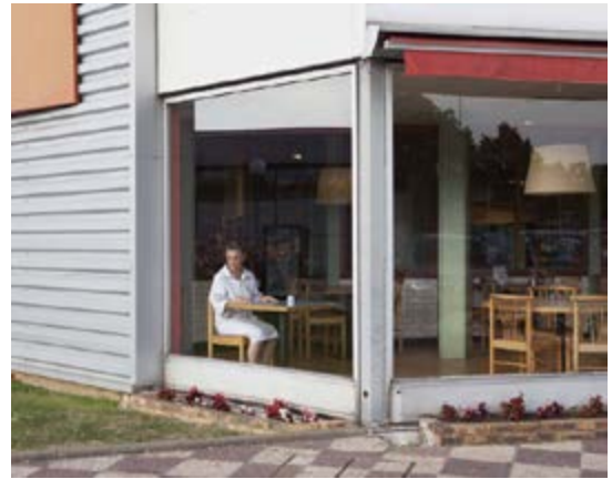
Marion Gambin France (s) territoire liquide Série « Entre deux lieux » Aire d'autoroute, France, 2013