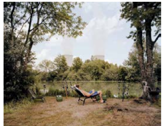
Jürgen Nefzger Série « Fluffy Clouds » Centrale nucléaire de Nogent sur Seine (Aube) , 2003, © Jürgen Nefzger, Courtesy Galerie Française Paviot, Paris BnF, Estampes et photographie