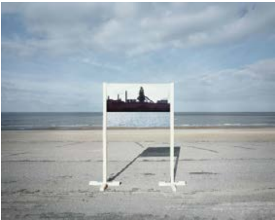
Guillaume Amat France(s) territoire liquide Série « Open fields », 2010