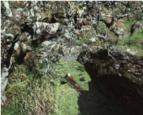
Thierry Girard Série « Arcadia revisitée » Scène VIII, 2011