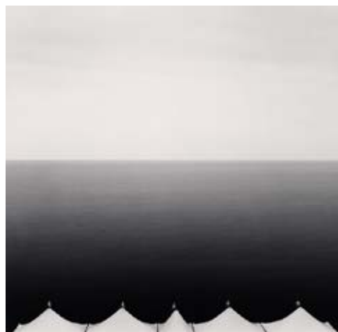
Michael Kenna Mission photographique du Conservatoire du littoral Série « L'Archipel de Chausey » 2007-2008 Five Canopies, Chausey Islands, France, 2007 Fonds géré par l'association À travers le paysage, Arles