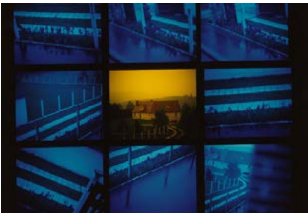
Tom Drahos Mission photographique de la DATAR Série « Banlieue parisienne, les espaces périurbains de la région parisienne » Chevreuse (Seine-et-Oise), 1986