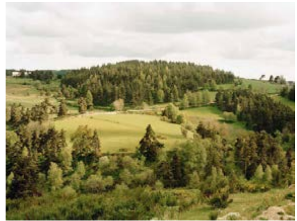
Thibaut Cuisset Série « Une campagne française » Sans titre (La Margeride, Lozère), 2010 © Thibaut Cuisset / Observatoire photographique national du paysage Galerie Les Filles du Calvaire, Paris