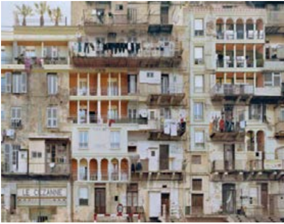
Stéphane Couturier Mission photographique du Centre méditerranéen de la photographie, commande « Sédimentations » Série « Melting Point », Bastia n°1 , 2007 © Stéphane Couturier- Courtesy La Galerie Particulière, Paris/Bruxelles Centre méditerranéen de la photographie, Bastia