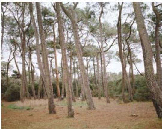
Patrick Messina France(s) territoire liquide, Série « Courte échelle » Courte échelle 2 - Kerver, Presqu'île de Rhuys, 2012