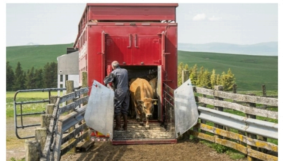
Avant de descendre de la bétailière, les vaches doivent montrer patte blanche.