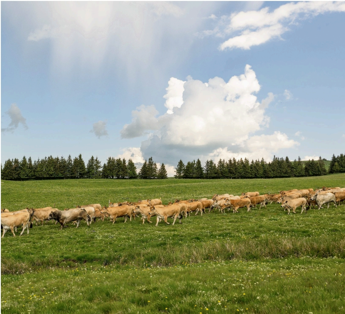
Un lot de bovins issus de différentes exploitations s'enfoncent dans l'immensité du Cézallier, à Pradiers, sur l'une des deux unités pastorales de la Coptasa.